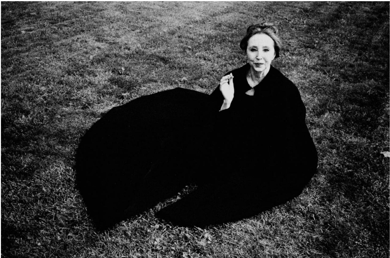
Anaïs Nin fotografiada a Nova York per Jill Krementz. Juny, 1971 (68 anys)